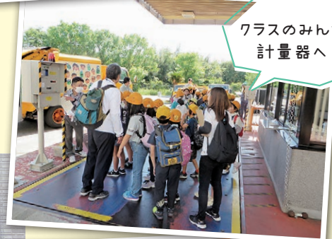
クラスみんなで計量器へ!