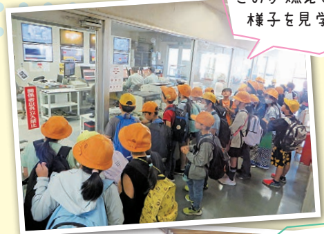
ごみが燃えている様子を見学。